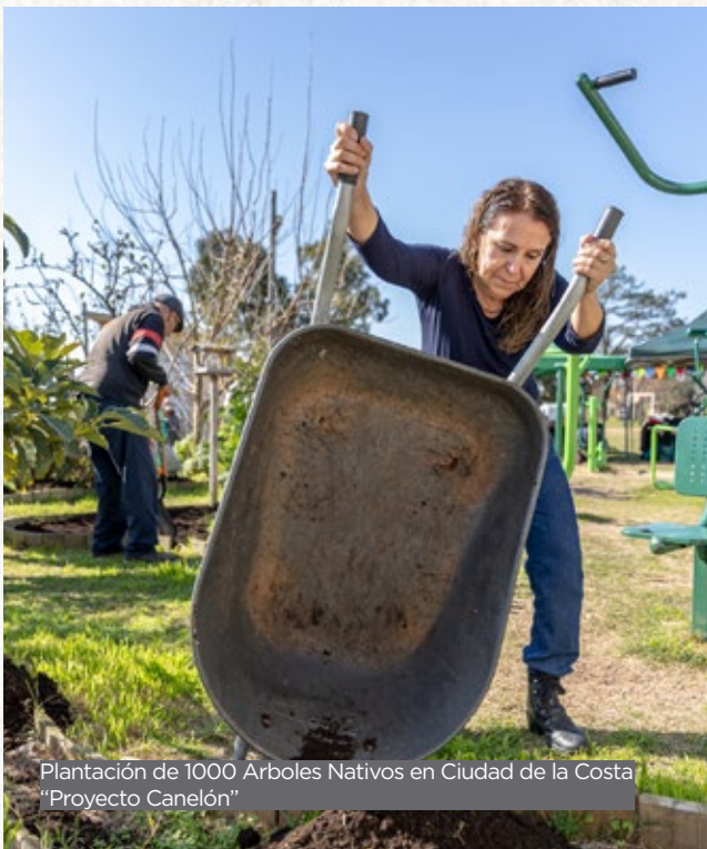
Plantación de 1000 Árboles Nativos en Ciudad de la Costa "Proyecto Canelón"

En 2022, durante el mes de junio, realizamos un foro transmitido por el canal web con cinco especialistas en temas ambientales para aprender sobre: 'hidrógeno verde', 'monitor de desarrollo sostenible', 'energías renovables', 'ciudades sostenibles' y 'cambio climático'.