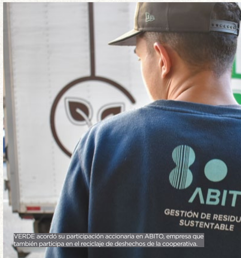
VERDE acordó su participación accionaria en ABITO, empresa que también participa en el reciclaje de deshechos de la cooperativa.

Implementamos un sistema de clasificación de residuos de acuerdo con la norma técnica